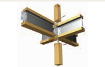
テクノストラクチャー工法

パナソニック独自の「テクノストラクチャー工法」で建てる木造住宅。それが「テクノストラクチャーの家」。木の温もりと鉄の強さをプラスした地震に強い家です。構造計算で耐震性や耐久性も確認し確かな安全性を実現します。