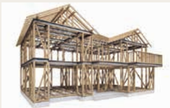
梁材にのみ鉄骨を使う理由

木は育成してきた縦向きの力には強いものの、横向きの力には弱いことが弱点。木造の弱い部分に鉄骨を用いることで、木と鉄骨の良い所を複合させた梁がテクノビームなのです。