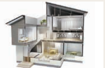
間取りの自由度と可変性

鉄を用いた梁と確かな構造計算で、柱の少ない広々空間を実現。自由設計、将来の間取りの変更も容易にできます。2階建ての場合、最大スパンは8m、天井高は最大約2.8m。