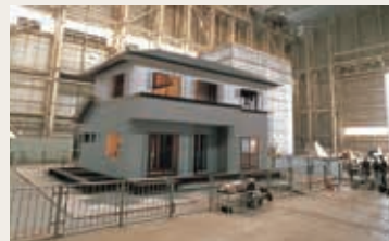
耐震性・耐風性・耐積雪性

実物大のモデルによる振動実験も行い、震度7の激震を計5回与えても構造強度に影響のない強さが実証されています。また、注文1棟ごとに構造計算を実施。388項目にも渡る構造計算書が発行され、建物の強さを保証します。