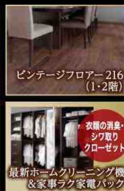
※掲載の写真はイメージです。