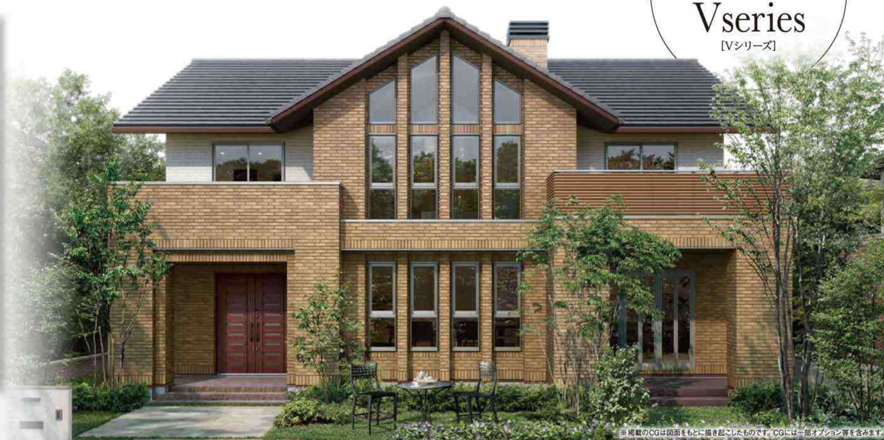
※掲載のCGは図面をもとに描き起こしたものです。CGには一部オプション等を含みます。

クレバリーホーム 2017年 新春 キャンペーン NEW YEAR CAMPAIGN